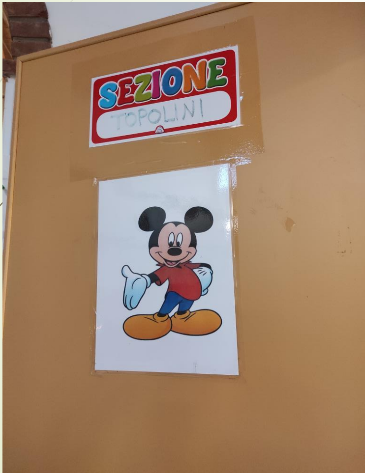
SEZIONE «A» TOPOLINI

La scuola dell'infanzia di Stagno Lombardo è formata da due sezioni: