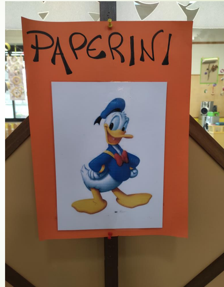
SEZIONE «B» PAPERINI